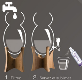
1. Filtrage 2. Servez et sublimez