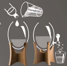
1. Versez et sublimez 2. Servez